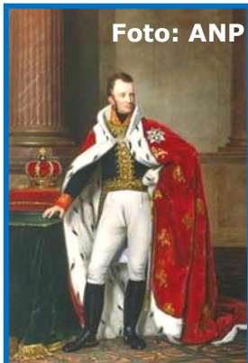
Koning Willem I