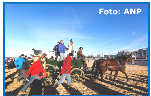
Oefenen voor het naspelen van de aankomst

1. Waar gaat de tekst over, denk je? Schrijf je voorspelling op.