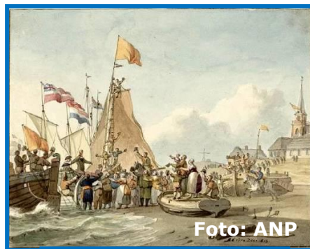
Schilderij van de aankomst van Willem I in Scheveningen